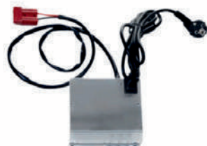
Cargador de baterías de vehículo