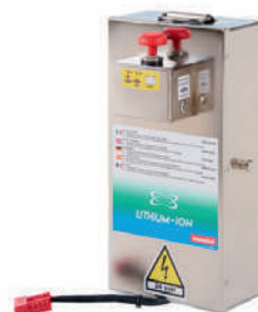
Batería de Litio 24V 55Ah