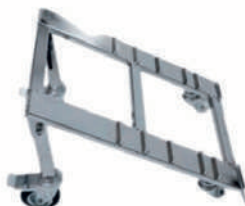
Base inclinada para exterior furgonetas