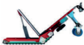
Brazo central para interior furgoneta