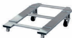
Base para rellenos estrechos