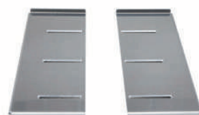
Base regulable en anchura hasta 80cm