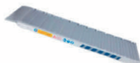
Rampa de aluminio