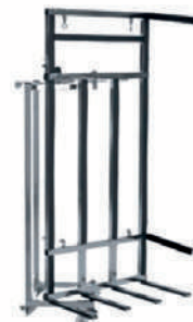
Accesorio para puertas ventanas y laterales