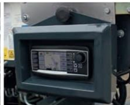
Display de diagnóstico y estado