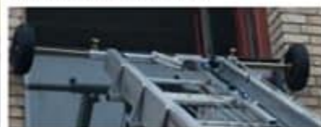
Ruedas de apoyo en cabezal