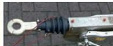
Enganche de ojal para camión