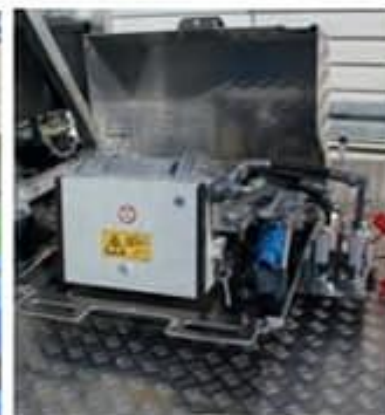
Sistema accionamiento 230 V E- DRIVE con bomba gemela