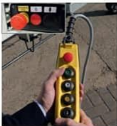
Sistema proporcional de accionamiento del carro