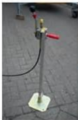
Cable de control mecánico