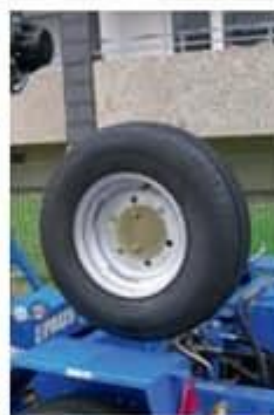
Rueda de repuesto