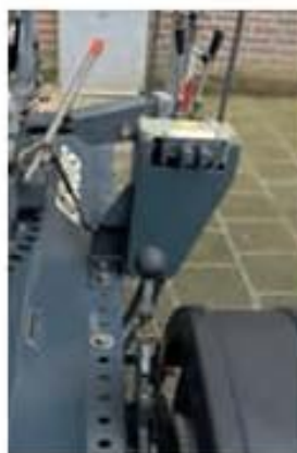
Sistema automotriz para remolques