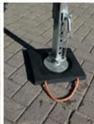
Bases para estabilizadores