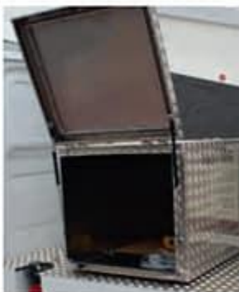
Caja de herramientas