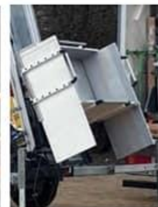
Laterales para plataforma de muebles alargados