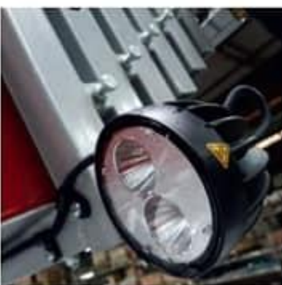
Luces de trabajo