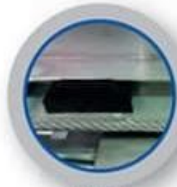
LIBRE DE MANTENIMIENTO