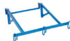
Colgador de cubos