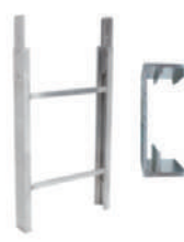
Tramo escalera 1m 250Kg