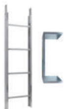
Tramo escalera 2m 200Kg