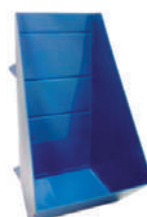
Caja basculante (SÓLO PARA CARRO BASCULANTE)