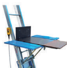
Plataforma VARIO + con sistema de elevación (TODOS LOS LATERALES ABATIBLES)