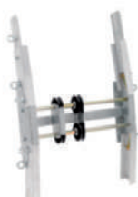
Tramo en ángulo corto