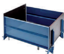
Plataforma VARIO con sistema de nivelación