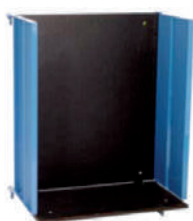
Plataforma de uso general