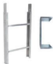
Tramo escalera 1m 200Kg