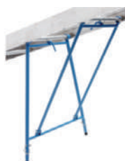
Apoyo para techos planos