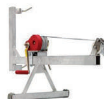
Brazo de montaje con cabestrante manual