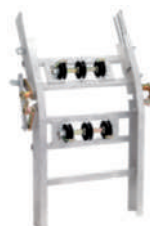
Tramo de 1 metro en ángulo operacional en ambos sentidos