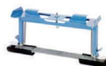
Apoyo de techo inclinado